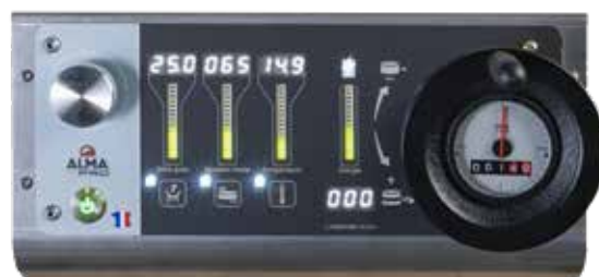
Précision & Contrôle